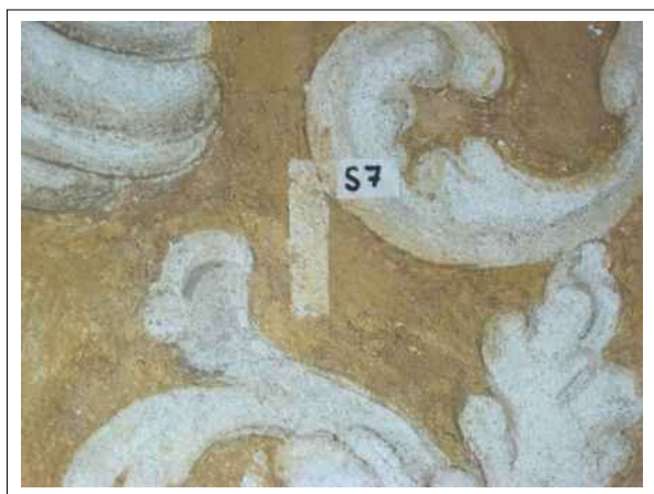
17. Stratigrafická sonda S7 vrstvou druhotné přemalby na úroveň originální nástěnné malby