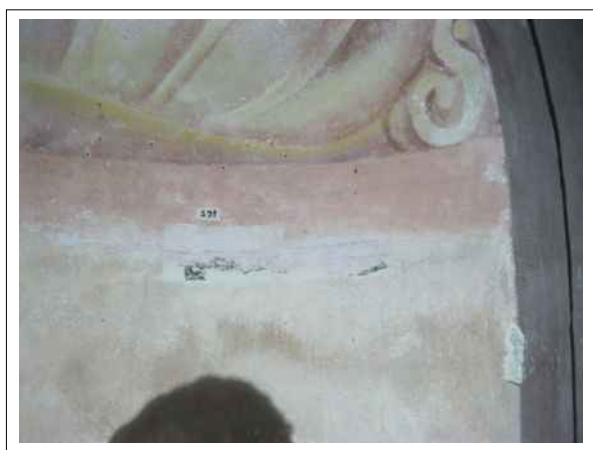
35. Stratigrafická sonda S31 vrstvou druhotné přemalby a štku na úroveň originální nástěnné malby v oblasti ozdobné niky