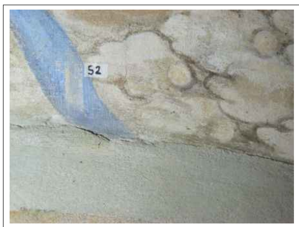
15. Stratigrafická sonda S2 vrstvou druhotné přemalby na úroveň originální nástěnné malby