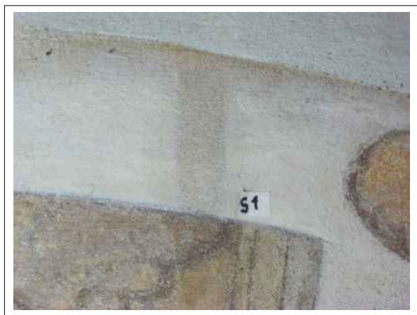
13. Stratigrafická sonda S1 vrstvou druhotné přemalby na úroveň originální nástěnné malby