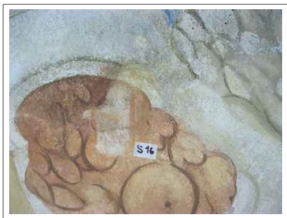
23. Stratigrafická sonda S16 vrstvou druhotné přemalby na úroveň originální nástěnné malby