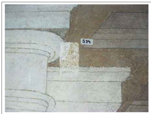
38. Stratigrafická sonda S34 vrstvou druhotné přemalby na úroveň originální nástěnné malby