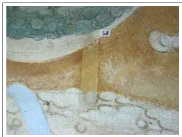
18. Stratigrafická sonda S8 vrstvou druhotné přemalby na úroveň originální nástěnné malby