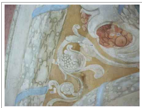
27. Stratigrafické sondy S13, S14, S15, S16, S18 vrstvy druhotné přemalby na úroveň originální nástěnné malby