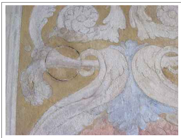
11. Stav nástěnných maleb před začátkem restaurátorského průzkumu – druhotná čárková retuš v oblasti zakrytí rozvodu staré elektroinstalace