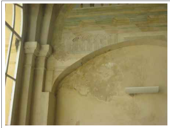
9. Stav nástěnných maleb před začátkem restaurátorského průzkumu – degradace omítkové vrstvy v důsledku zatečení (mapy, výkvěty vodou rozpustných solí)