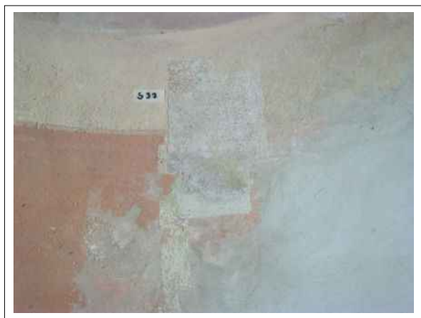
37. Stratigrafická sonda S33 vrstvou druhotné přemalby a štku na úroveň originální nástěnné malby v oblasti ozdobné niky