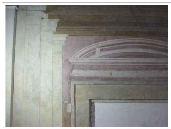
40. Stratigrafické sondy S34, S35, S36 vrstvami druhotné přemalby na úroveň originální nástěnné malby