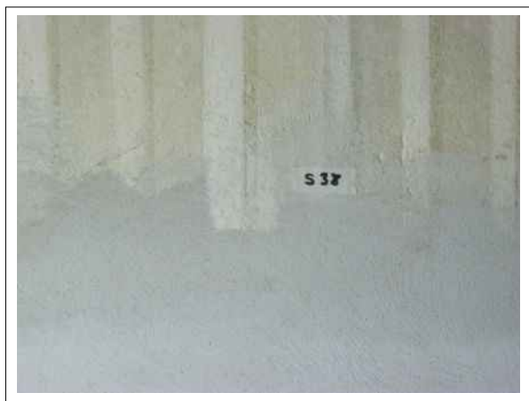
41. Stratigrafická sonda S38 vrstvou druhotného cementového štuky na úroveň originální nástěnné malby v oblasti soklu sálu