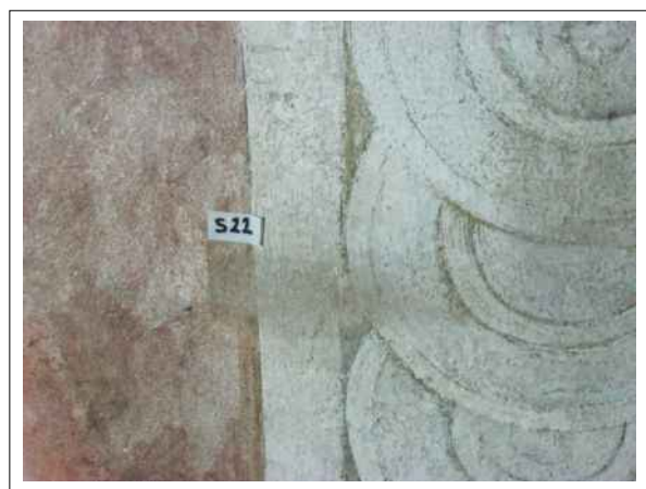
28. Stratigrafická sonda S22 vrstvou druhotné přemalby na úroveň originální nástěnné malby