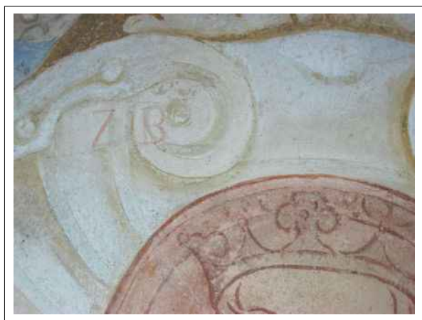
21. Fragment textového motivu, dochovaného v oblasti fabionu sálu