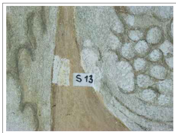
26. Stratigrafická sonda S13 vrstvou druhotné přemalby na úroveň originální nástěnné malby