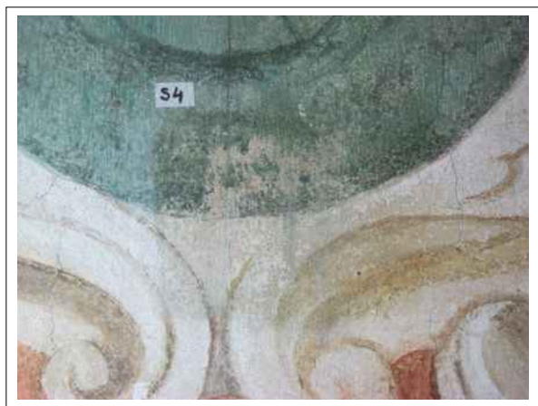
14. Stratigrafická sonda S4 vrstvou druhotné přemalby na úroveň originální nástěnné malby