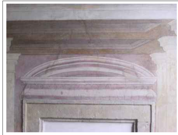
10. Stav nástěnných maleb před začátkem restaurátorského průzkumu – ztmavnutí barevné retuše v oblasti druhotně vymezených statických trhlin nad kamenným ostěním