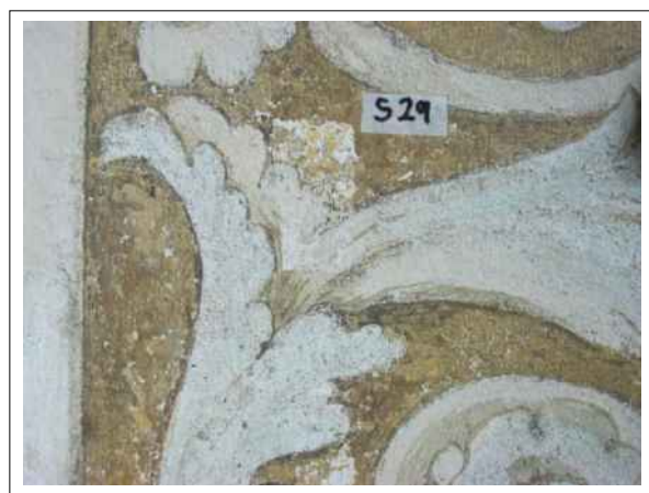
32. Stratigrafická sonda S29 vrstvou druhotné přemalby na úrovni originální nástěnné malby