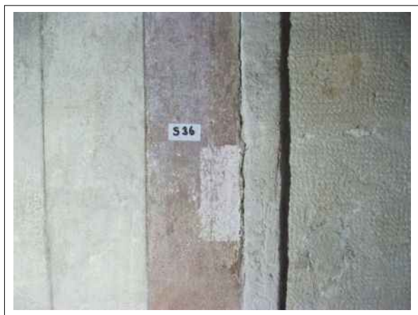
39. Stratigrafická sonda S36 vrstvou druhotné přemalby na úroveň originální nástěnné malby