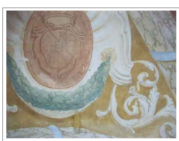
22. Stratigrafické sondy S7, S8, S9, S10 vrstvami druhotné přemalby na úroveň originální nástěnné malby