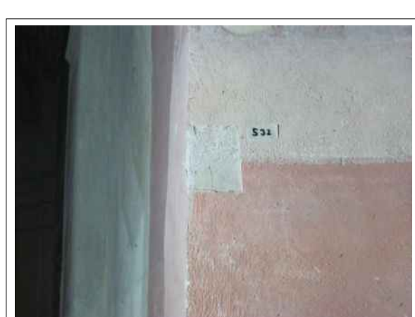
36. Stratigrafická sonda S32 vrstvou druhotné přemalby a štku na úroveň originální nástěnné malby v oblasti ozdobné niky