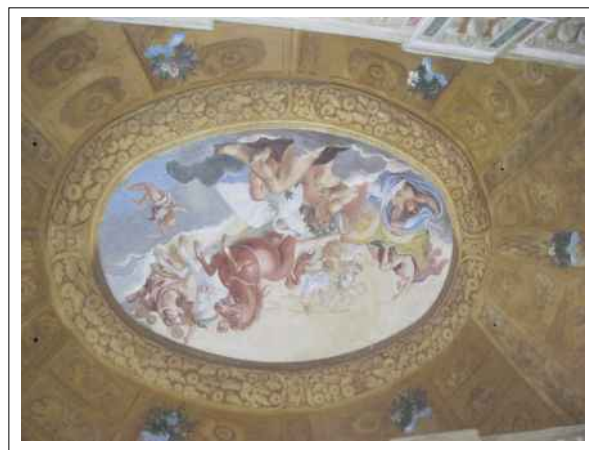
12. Stav nástěnných maleb před začátkem restaurátorského průzkumu – nástropní figurální kompozice