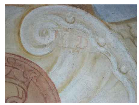
20. Fragment textového motivu, dochovaného v oblasti fabionu sálu