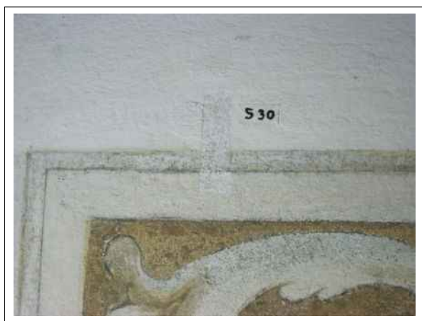
31. Stratigrafická sonda S30 vrstvou druhotné přemalby na úrovni originální nástěnné malby