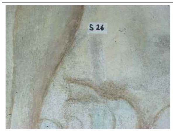
29. Stratigrafická sonda S26 vrstvou druhotné přemalby na úrovni originální nástěnné malby