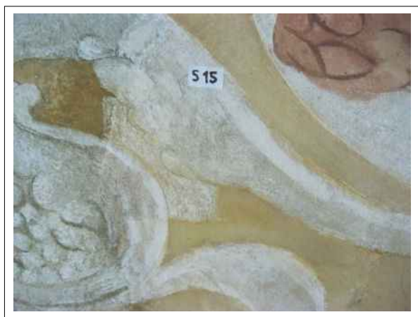
25. Stratigrafická sonda S15 vrstvou druhotné přemalby na úroveň originální nástěnné malby