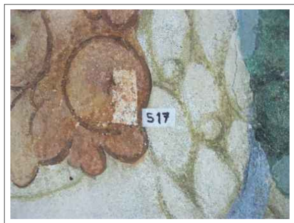
24. Stratigrafická sonda S17 vrstvou druhotné přemalby na úroveň originální nástěnné malby