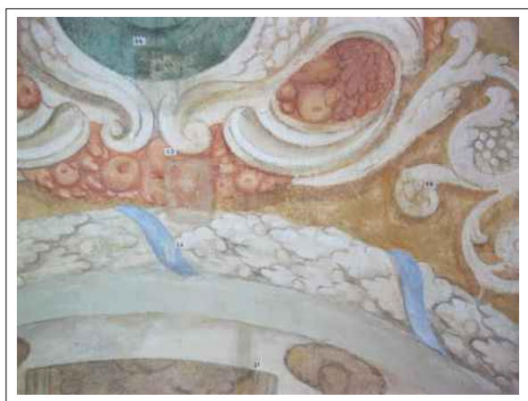
16. Stratigrafické sondy S1, S2, S3, S4, S5 vrstvami druhotné přemalby na úroveň originální nástěnné malby