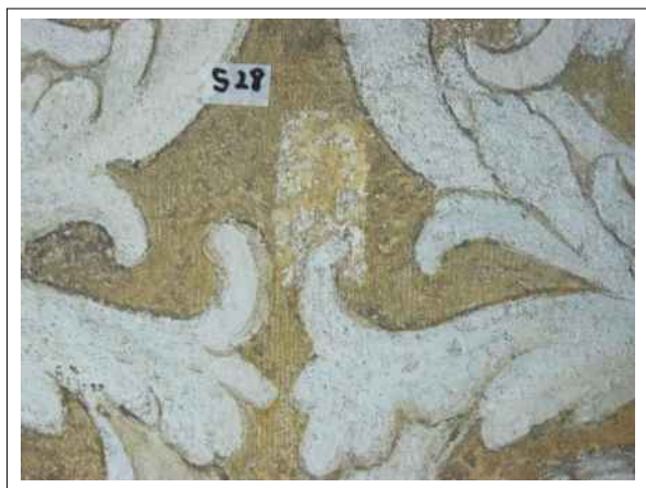
33. Stratigrafická sonda S28 vrstvou druhotné přemalby na úroveň originální nástěnné malby