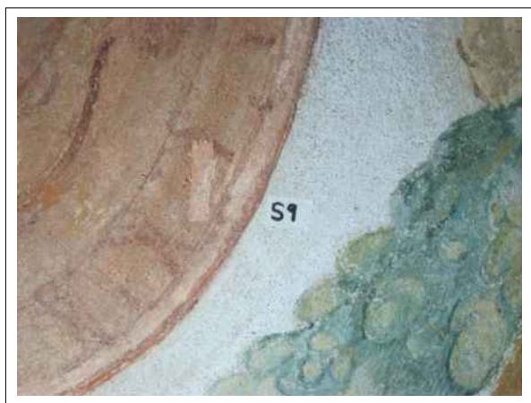
19. Stratigrafická sonda S9 vrstvou druhotné přemalby na úroveň originální nástěnné malby